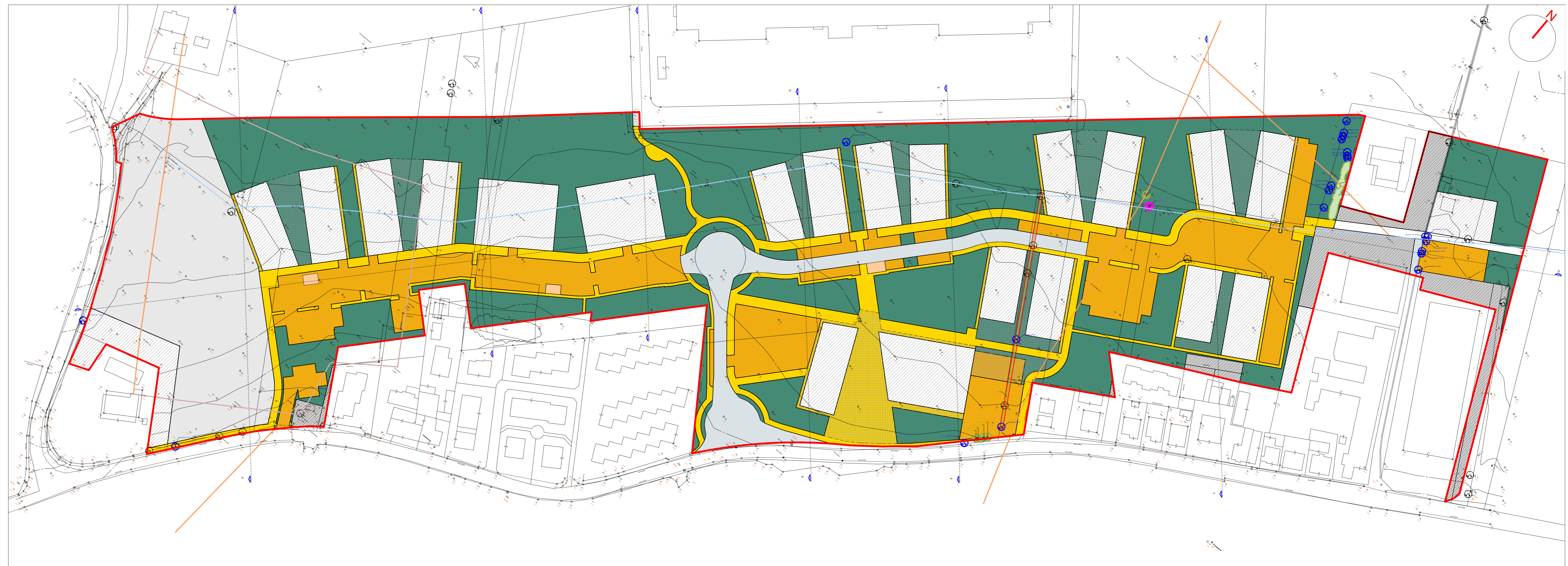
VARIANTE DI P.R.G. SUL RILIEVO scala 1:1000