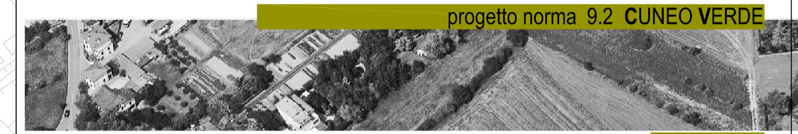
progetto norma 9.2 CUNEO VERDE