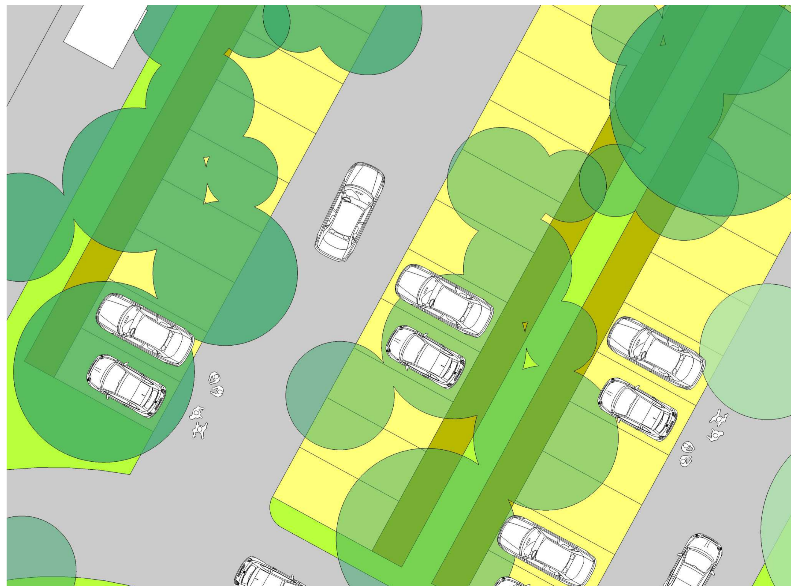
Parcheggi pubblici | Disegno stalli con sistemazioni vegetali del Bosco-parcheggio