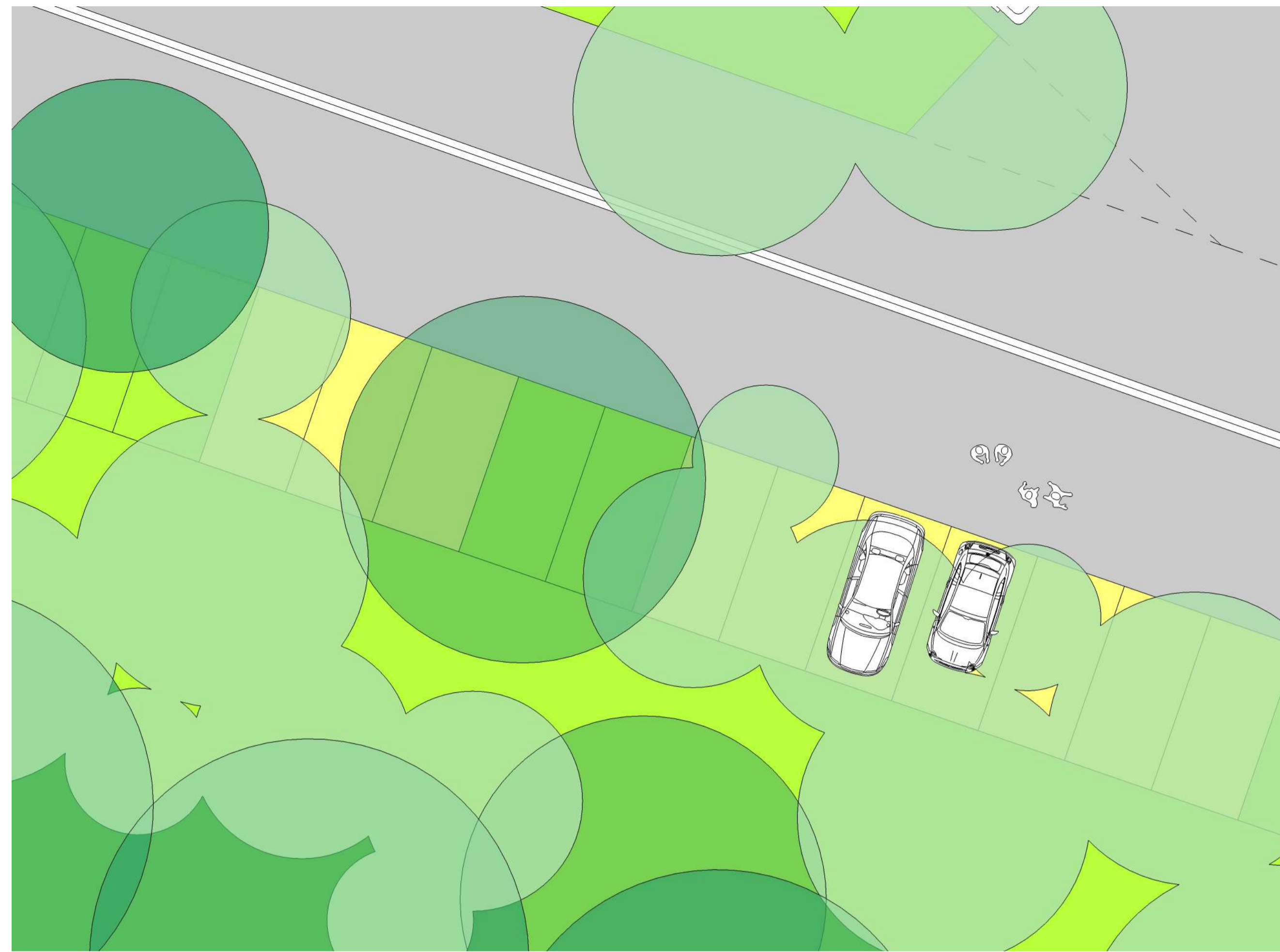
Parcheggi privati | Disegno stalli con sistemazioni vegetali del Bosco-parcheggio