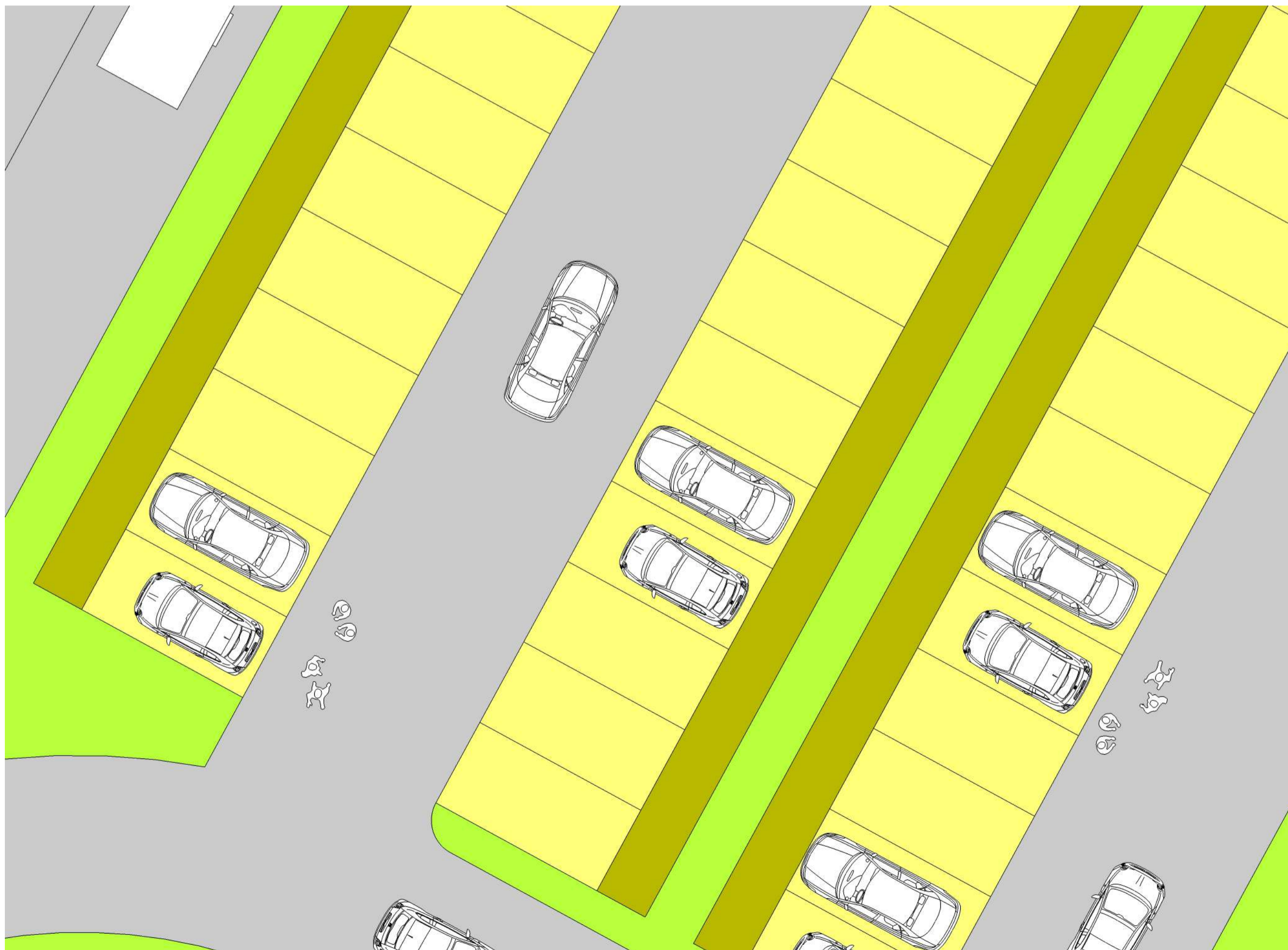
Parcheggi pubblici | Disegno stalli senza sistemazioni vegetali del Bosco-parcheggio