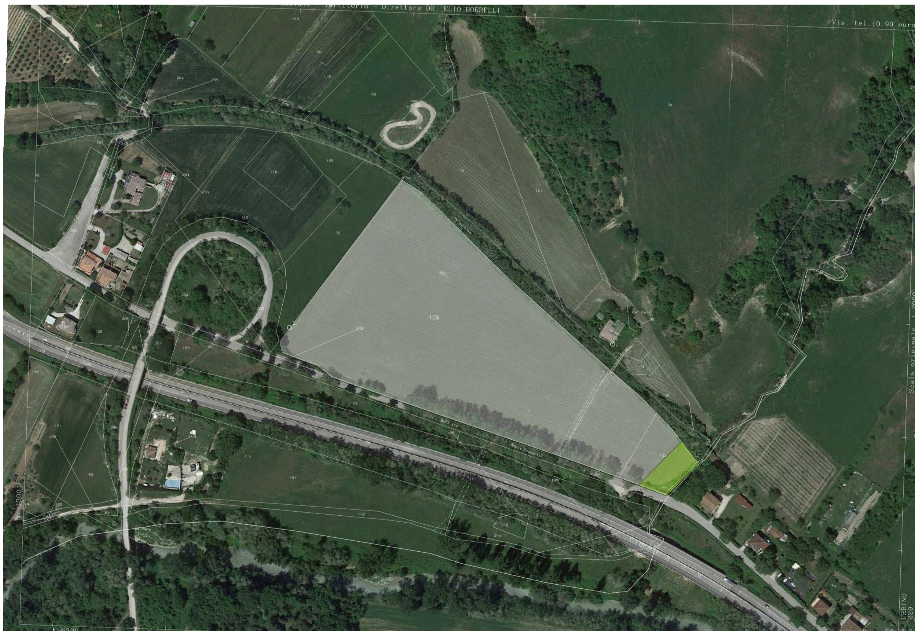
Foto aerea dell'area proposta in variante con perimetrazione