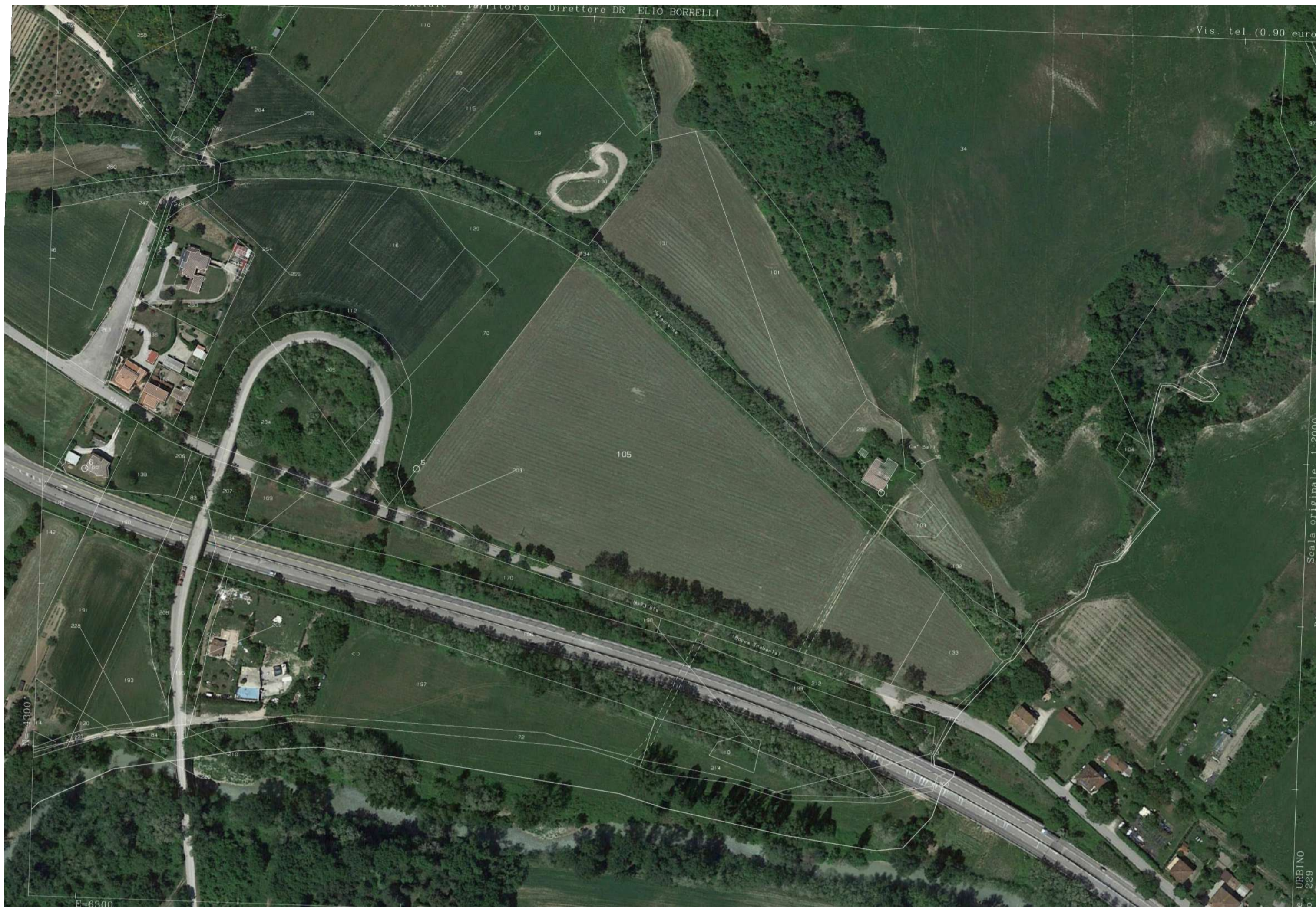
Foto aerea dell'area proposta in variante