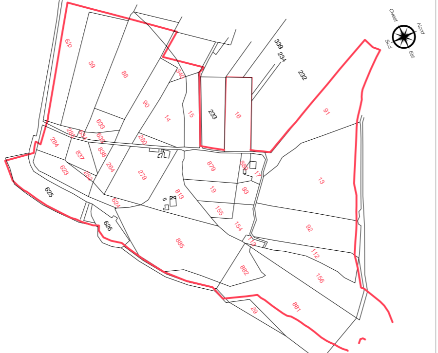
PLANIMETRIA CATASTALE - Scala 1:2000 - Foglio n° 8