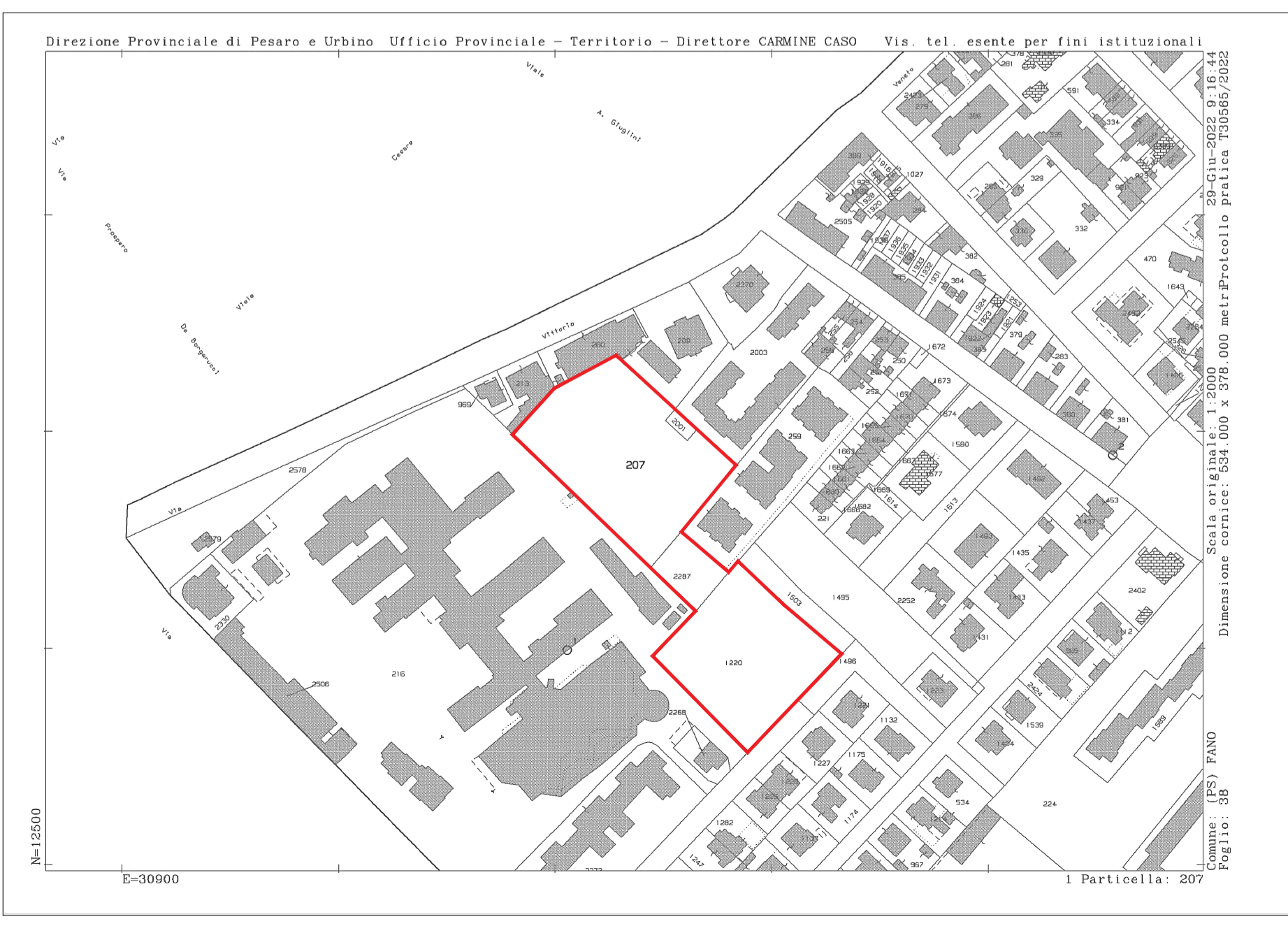
STRALCIO MAPPA CATASTALE FOGLIO 38 COMUNE DI FANO