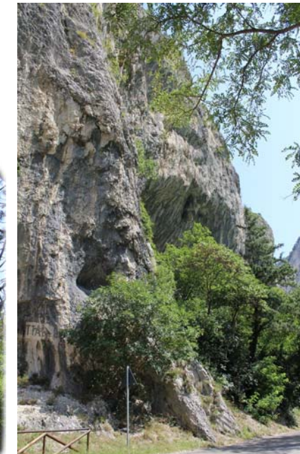
Immagini di alcune barriere paramassi in legno da ripristinare.