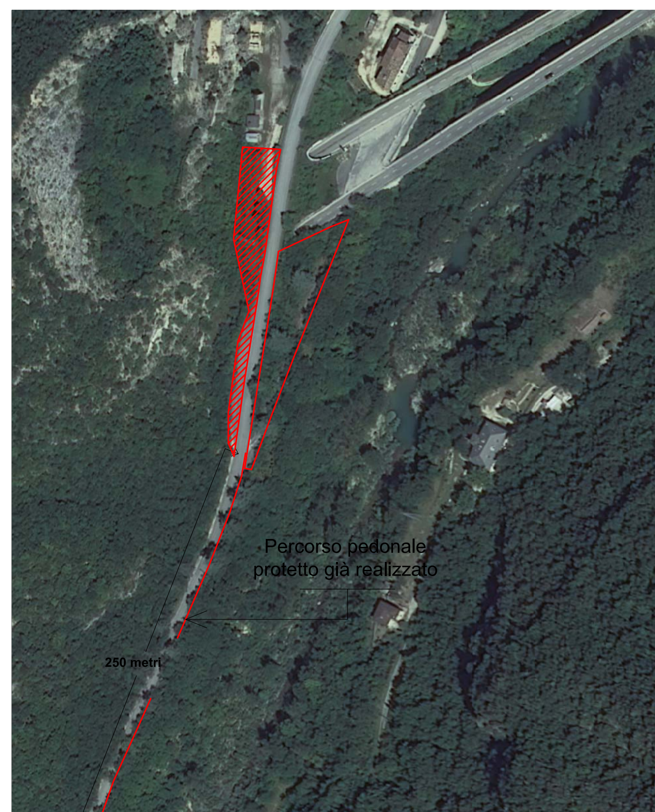
Estratto ortofoto AGEA con evidenziate le aree già oggetto di intervento e la nuova area che prevede la realizzazione di parcheggi attraverso il recupero di un relitto stradale di proprietà ANAS parallelo alla carreggiata della S.S. n. 3 "Flaminia" - Scala 1:2.000