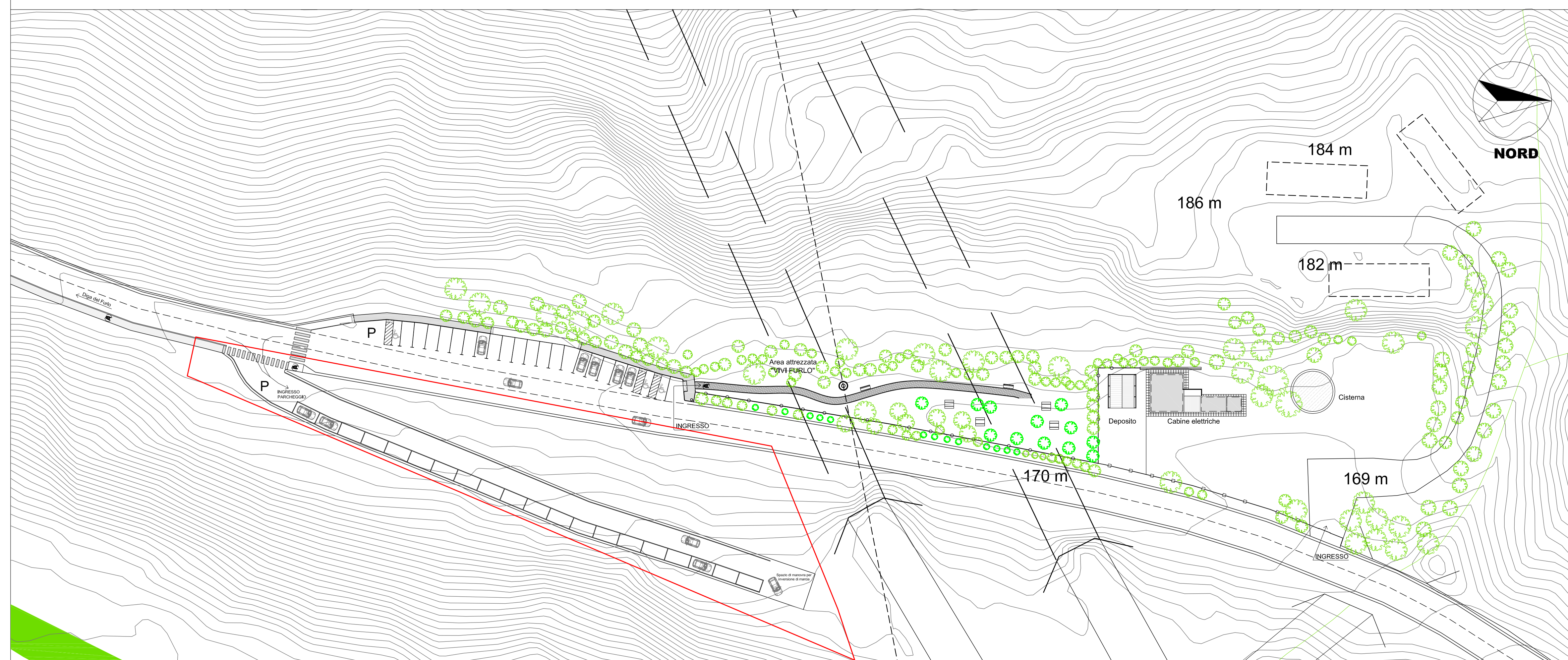
Progetto di sistemazione dell'area oggetto d'intervento - Scala 1:500