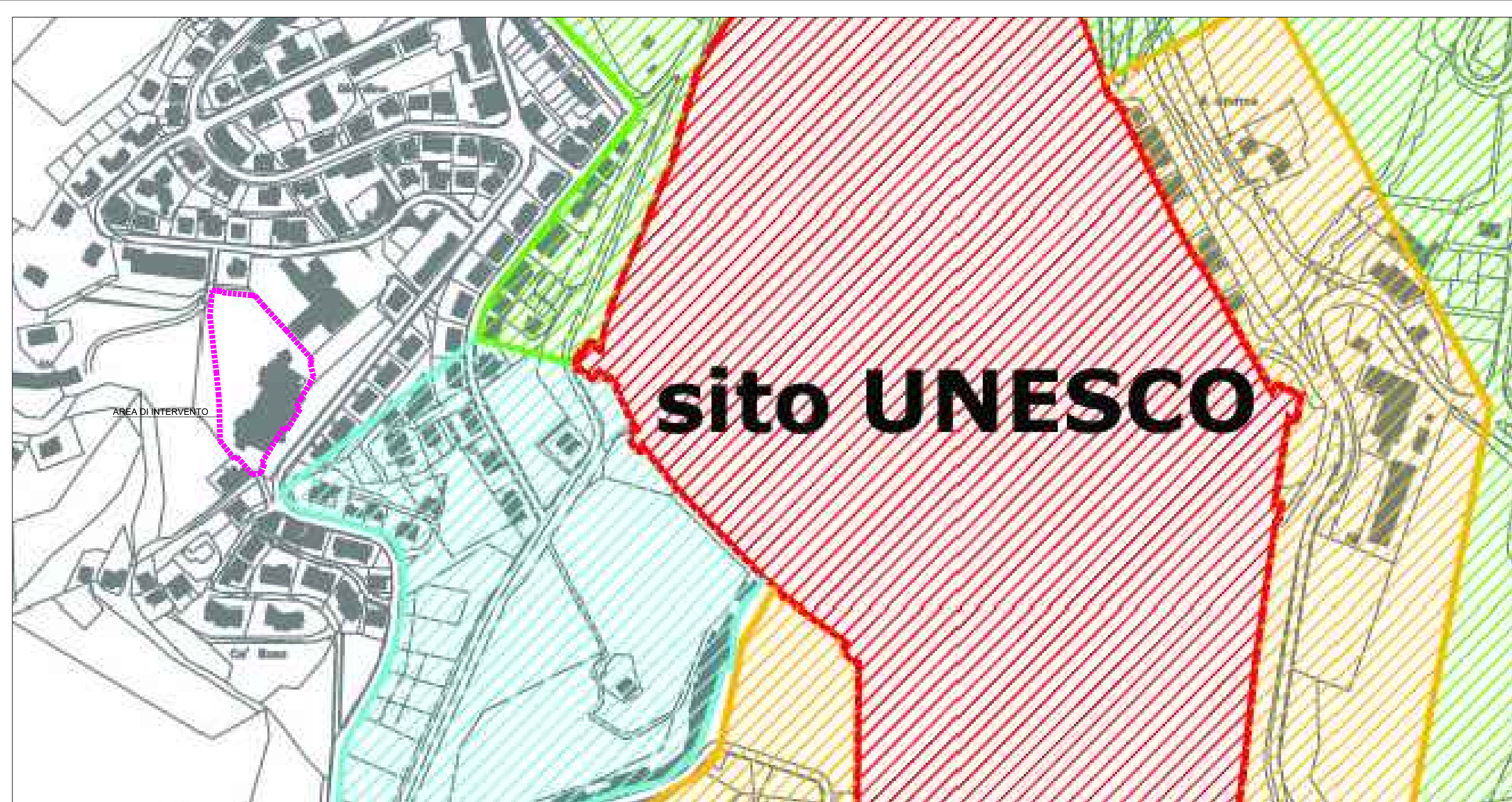
AREE VINCOLATE PAESAGGISTICAMENTE CON DECRETO D.Lgs 490 - Titolo II (ex legge 431 del 1985) - scala 1:2000