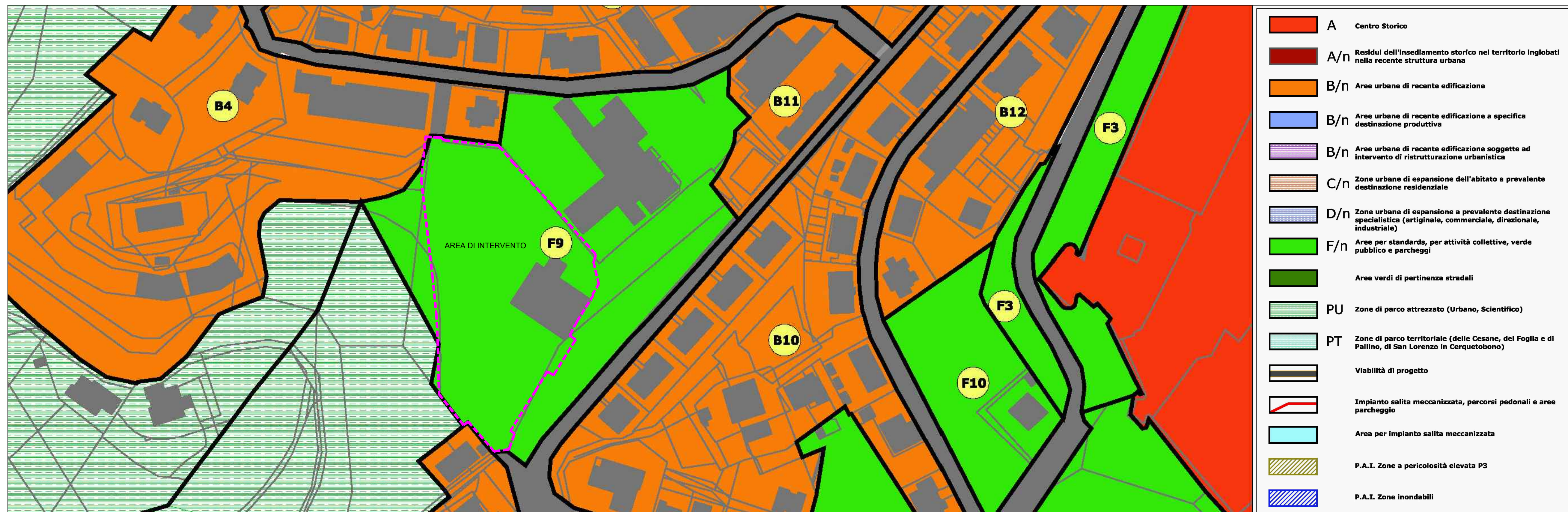
ESTRATTO P.R.G. - scala 1:1000